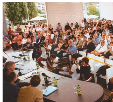
Festival de Lo carno.

♦ Del 6 al 16 de agosto se celebra en Lorcarno el Festival del Film homónimo. Como cada año, contará con las secciones habituales con la novedad en esta edición de la sección "Aquí y en todas partes" en la que se proyectarán films, documentales y ficciones que ofrezcan una visión de la vida contemporánea y reflejen aspectos de históricos y políticos además de aspectos sociales y culturales. Destacar que este año el laboratorio de coproduc-