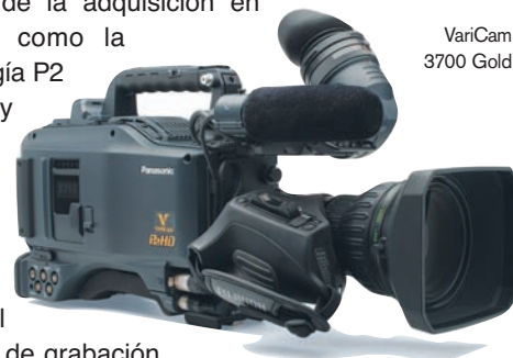
VariCam 3700 Gold