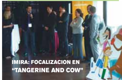
IMIRA: FOCALIZACION EN "TANGERINE AND COW"

tion Pictures posee un considerable catálogo con más de 1200 horas de animación (además de 1500 películas, 600 tv movies, etc). En este mipTV su producto estrella era "LMN's" una serie de animación dirigida por Josep Esteve en formato 52x13'. Otros productos disponibles eran "Boom & Reds" (104x4'), "Telmo & Tula - Arts & Crafts" (52x7') y "Block" (20x13').