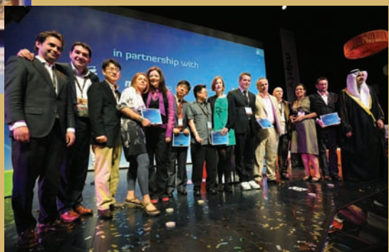
Premiados de Content 360 con los representantes de WakeUp en primer plano.