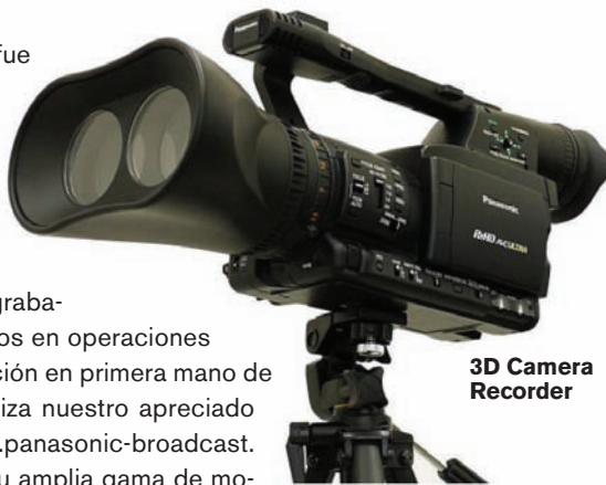
3D Camera Recorder