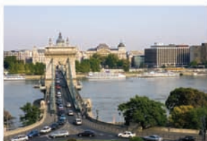
DISCOP EAST has been held in Budapest since 1991

El Ministro de Industria decía a mediados de abril que "la TDT de pago sería una realidad en España al igual que ya se ha implantado en otros países europeos". Se trata de un negocio valorado en 5000 millones durante los próximos cuatro años, que está en el alero a la espera que el Ejecutivo permita, caso por caso, las nuevas emisiones.