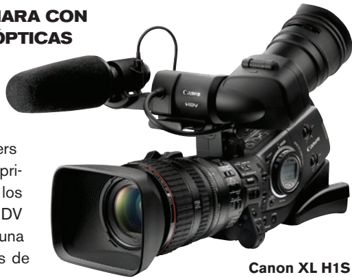
Canon XL H1S

También en esta misma línea de productos Canon (ver www.canonbroadcast.com ) tiene novedades: las nuevas camcorders XL, XH y VIXIA S10. De la primera familia encontramos los modelos H1S y H1A en HDV a las que Canon incorpora una óptica de 20x, que además de los controles manuales de foco y