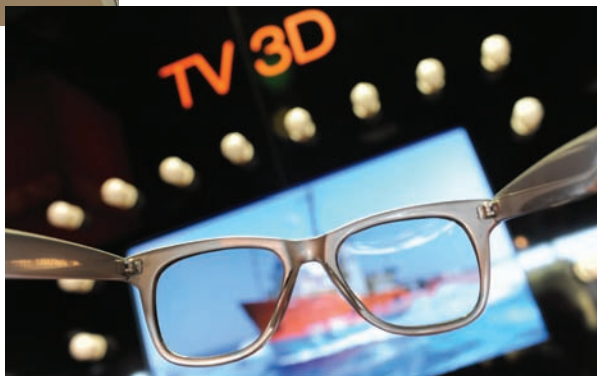
Visión en 3D.

A lo largo del MIPTV, las compañías aprovechan para presentar sus series exitosas. Endemol presentó en una brillante "puesta en escena" en 3D sus formatos tradicionales de entretenimiento mientras HBO, otra referencia indiscutida, mantiene la apuesta por la contunuidad de series de calidad, como 'Sexo en Nueva York' o 'Los Sopranos'. Además la firma rentabilizará pronto la "obamania" porque ha hecho el seguimiento audiovisual del actual presidente americano desde los primeros mítines de