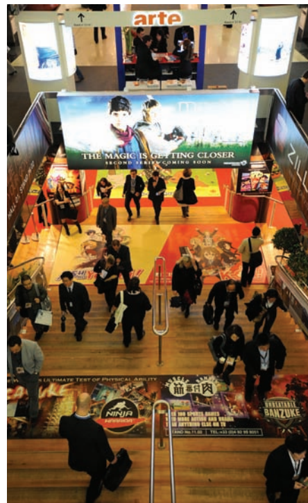
Aspecto de la entrada de MIPTV.

Todo empieza con el escritor sueco Stieg Larsson: Escribe una trilogía de libros -Millennium- que no consigue publicar. A su muerte se editan sus libros y son un éxito. "Los hombres que odian a las mujeres" se convierte en un "best seller" con más de 10 millones de libros vendidos... A raíz de este éxito escandinavo ahora aparecen la serie televisiva de 6 x 90' y la película de 150'. Stieg Larsson, por cierto murió sin testar y todo el éxito de Millennium lo han cobrado sus padres con quienes no se llevaba especialmente bien... La representación española de la película corre a cargo de Agustín Serra de Savor www.savor.es