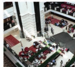
2000 participants are expected at DISCOP EAST 09

NATPE DISCOP 09 MULTIPLATFORM CONTENT BUSINESS IN CENTRAL, EASTERN EUROPE, AND EURASIA EAST