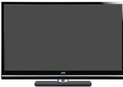
Display 3D de JVC modelo GD-463D10.

JVC aprovechó NAB para presentar dos novedades importantes: un display para visionado 3D, su primera cámara 4K y lo ya visto en últimos meses, las camcorders de estado sólido (SDHC o SXS) lanzados en Europa y que ahora se presentan al mercado "americano". De estas cámaras de la serie GY-HM, que graban en HD multiformato sobre tarjetas universales y significan un paso decisivo en la tendencia de grabación "tapeless", se ofrecen sus características en: www.gy-hm.es . En relación a las novedades NAB (ver www.jvc.com/pro ) destacamos la presentación del primer display profesional 3D de JVC: el GD-463D10, (visionado Full HD en 3D de 46") y especialmente la cámara 4K KY-F4000 con visionado en directo sobre un display LCD también 4K. Accediendo a la web antes indicada encontraremos las opiniones, presentaciones y demos del producto ante una webcasting en el stand del NAB de la firma.