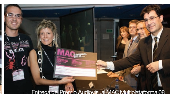
Entrega del Premio Audiovisual MAC Multiplataforma 08