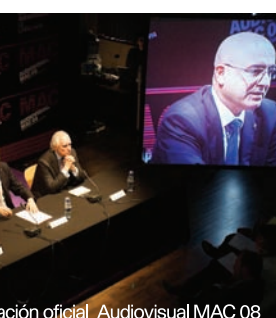
Reunión oficial Audiovisual MAC 08

Para más información: www.audiovisualmac.com