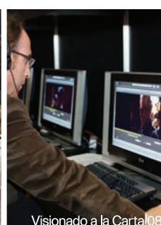
Visionado a la Carta 08