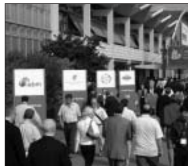
Exterior del recinto donde aconteció el IBC

IBC también ha mostrado los primeros prototipos de "holográfica media": nuevos soportes con capacidad de 300 Gb con velocidades de transferencia del orden de 160 Mbps y cuyo lanzamiento según nos explicaban en IBC sería ya en el segundo semestre del año que viene. La tecnología de grabación holográfica utiliza una linterna láser que graba datos en una imagen holográfica en 3D: De ahí las cifras de almacenamiento que maneja... En Maxell, Stephen Boyd que dirige la división europea de la firma explicaba que el nuevo soporte holográfico facilitará sobretodo las grabaciones de HD. El prototipo que allí tenían de 300 Gb permite grabar 35 horas de vídeo HD en calidad broadcast... Junto a este soporte profesional, en Blu-ray firmas como TDK ya ofrecían discos con 100 Gb de capacidad.