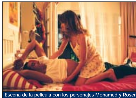
Escena de la película con los personajes Mohamed y Roser

tas, mejor quedarse en casa. Adelante con el coche y... ¡Acción!