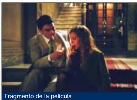
Fragmento de la película

y la colección de negativas, a cada cual más contundente. El desánimo pero, no entra en nuestro ideario. Encuentro rocambolesco con Zip-Films. La película tirará hacia delante